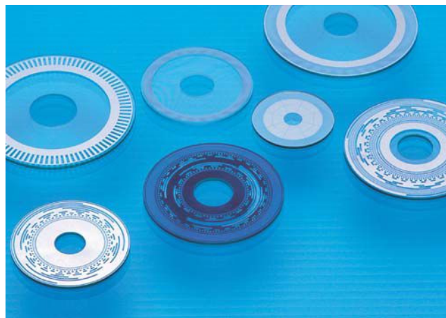
ロータリーエンコーダスリット板

ロータリーエンコーダスリット板 ガラスフォトマスク 各種光学スケール／レチクル／3Dパターン レンズ・プリズム・ミラーなどの光学部品