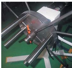
プレスコイル材巻取装置