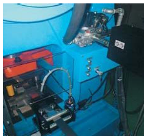
プレス油滴下装置