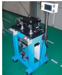
小型プレス専用機