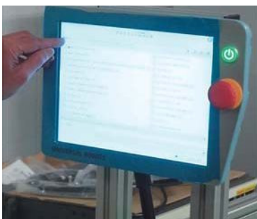
ユニバーサルロボット(デンマーク)認定システムインテグレーター