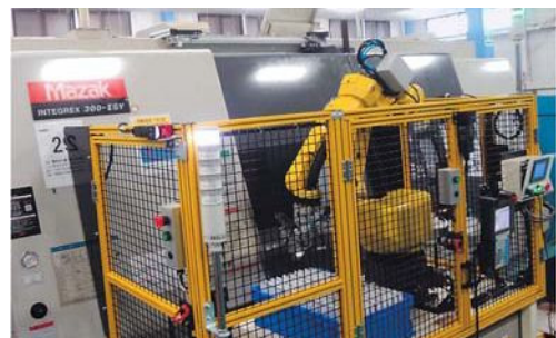
複合加工機×ロボットローダー