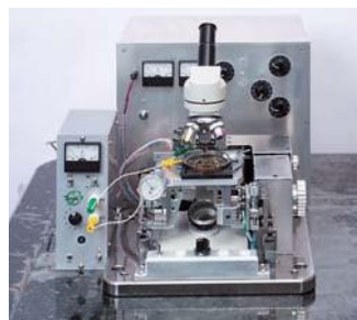
マイクロ放電ボール盤 (マイクロマシニングの 基礎工作機械)