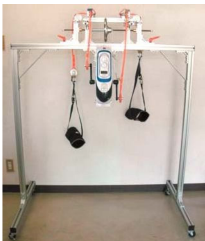
リハビリトレーナー（上下運動用）