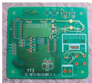
両面・多層配線板

メタルベース配線板 片面複層配線板 銅ペースト配線板 両面・多層配線板 CAD設計 金型・治工具