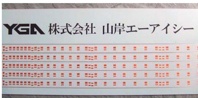
メタルベース配線板